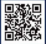
リクエスト大会 投票フォーム